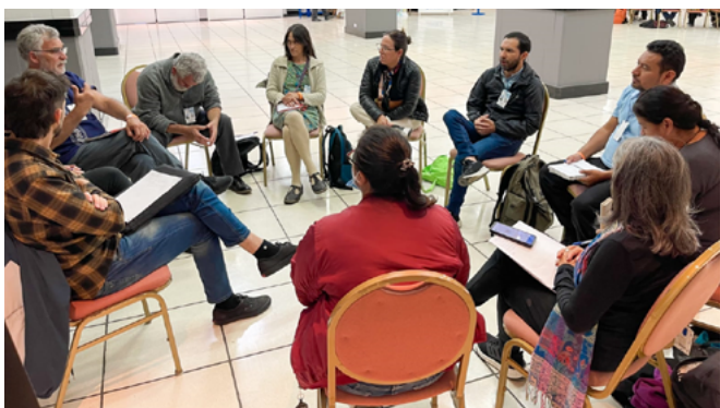
Reunión entre representantes de organizaciones sociales y ReAct Latinoamérica para articular acciones conjuntas frente a la RAM.