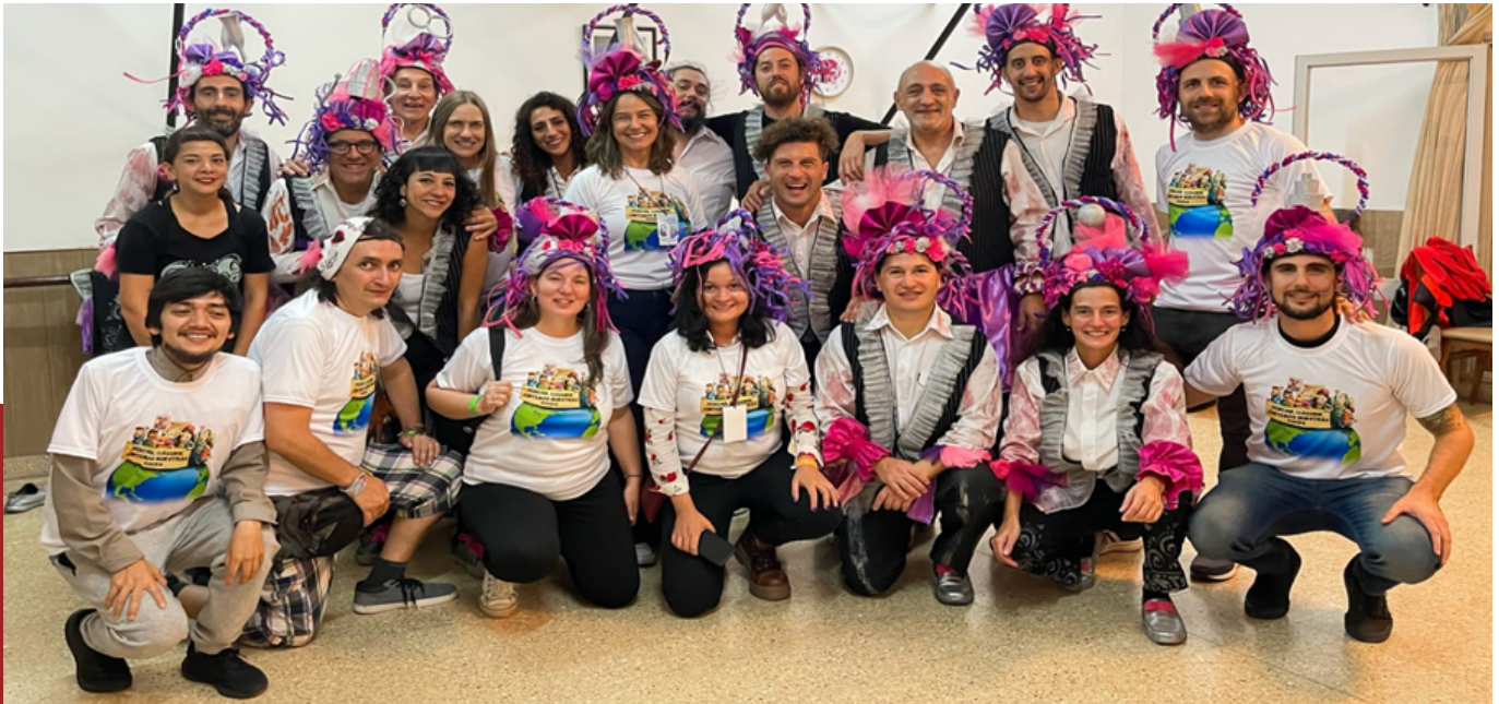
Murga Marplatense "Confusa Algarabía" y miembros del equipo de ReAct Latinoamérica