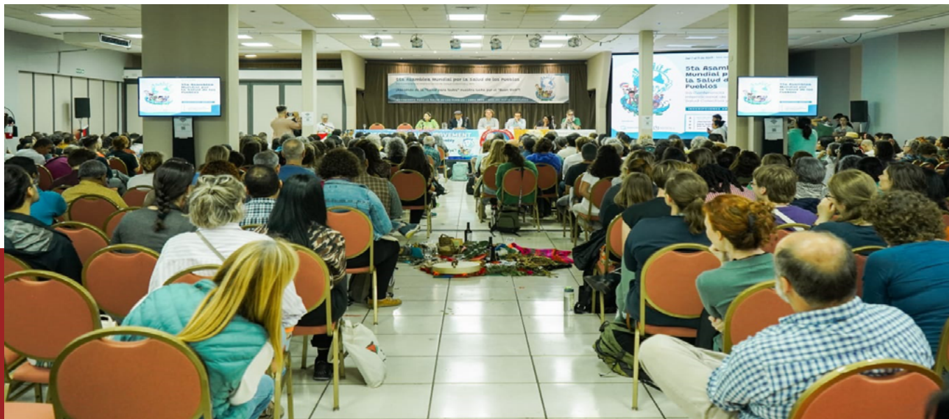
Mesa de apertura de la 5ta Asamblea Mundial por la salud de los pueblos

Entre el 7 y el 11 de abril de 2024, la ciudad de Mar del Plata, Argentina, acogió la 5ta Asamblea Mundial por la Salud de los Pueblos, un evento organizado por el Movimiento por la Salud de los Pueblos (MSP) que reunió a más de 600 representantes de organizaciones sociales, provenientes de 60 países, en los que se destacan defensores de derechos humanos, activistas por los derechos de los pueblos indígenas, trabajadores de la salud, académicos, líderes comunitarios y artistas de todo el mundo para articular estrategias conjuntas que permitan tomar acciones frente a los determinantes sociales, ambientales y económicos de la salud.