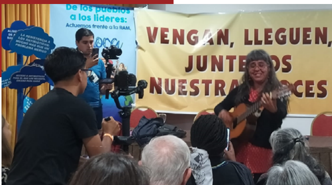
La artista argentina Marita Moyano interpretando una adaptación de la canción "Todas las voces, todas" en el marco de la presentación del "Llamado a la Acción Global frente a la RAM"

La RAM es un problema complejo que no puede ser abordado por un solo sector o institución o desde una visión únicamente médica, requiere un abordaje holístico y multisectorial que reconozca las interacciones entre la salud humana, animal y de los ecosistemas a través del enfoque Una Salud. Es necesario que todos los sectores de la sociedad trabajemos juntos para comprender las causas subyacentes y desarrollemos estrategias efectivas para contenerla, considerando que la educación y la conciencia sobre la RAM son clave para cambiar los comportamientos y reducir el uso inapropiado de antimicrobianos en medicina humana, medicina veterinaria y en la producción de alimentos, así como promover la implementación de políticas públicas que consideren los contextos de las comunidades más vulnerables.